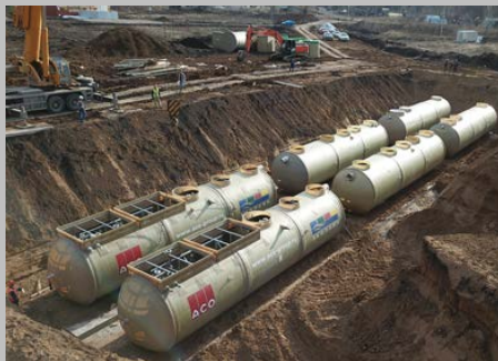
КОС ЭКО-Р-1000, ЖК "Цветы Башкирии", г. Уфа