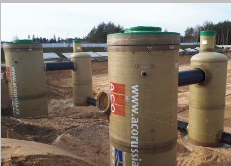
Индустриальный парк "Великий камень" "Оборудование для очистки поверхностного стока в составе ЛОС накопительного типа с самым большим в мире безбетонным аккумулярующим резервуаром АСО StormBrixx, Минск, Республика Беларусь